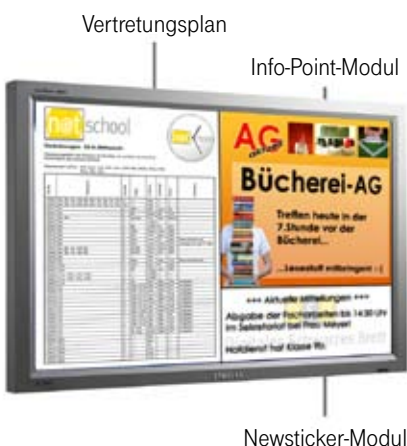
Das Info-Modul-System sorgt für die übersichtliche Darstellung aller wichtigen Inhalte.

Modul 3: Newsticker. Auf diesem „Laufband“ können die aktuellsten schulischen Nachrichten als „Top-News“ dargestellt werden. Die schnelle Eingabe über das Content Management System im Internet ist nur Berechtigten erlaubt.